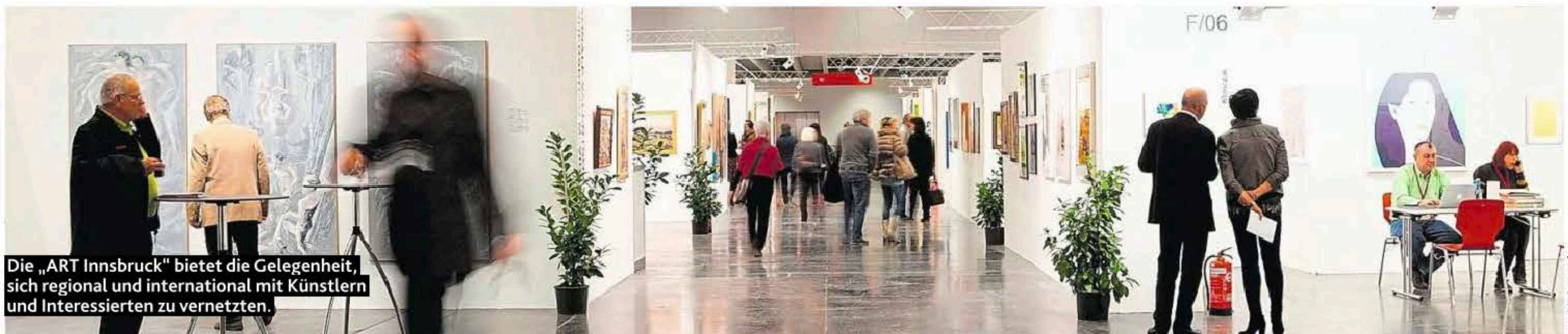
Die „ART Innsbruck“ bietet die Gelegenheit, sich regional und international mit Künstlern und Interessierten zu vernetzen.